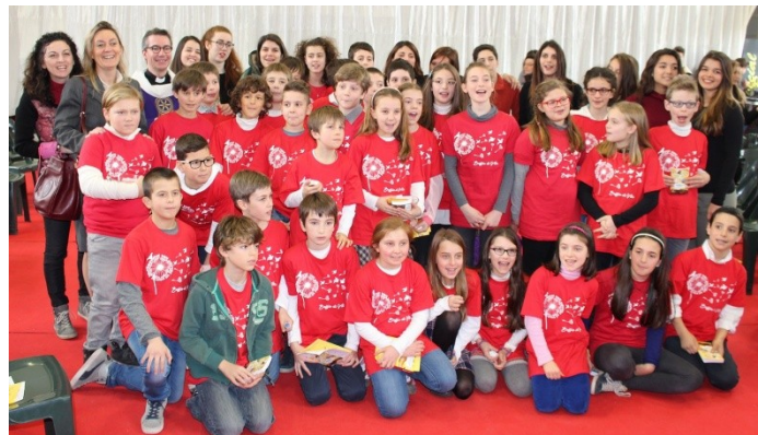
Le catechiste del gruppo Gerusalemme

E' stato davvero un momento emozionante, reso possibile anche dall'aiuto di tante persone che da anni ci seguono con cuore, amore e passione, in particolare i genitori, che non ci abbandonano mai, accettano con entusiasmo tutte le nostre proposte e ci danno una carica enorme, e i nostri animatori, sempre presenti e disponibili, senza i quali non potremmo essere un gruppo così! Grazie a tutti.